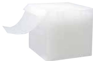
プチボードケース付き